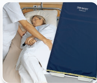
SAMARIT Rollbord H-Line