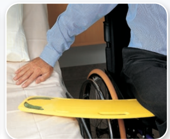
Équipement de soins infirmiers SAMARIT

Téléchargez sur notre site une brochure dans votre langue ou adressez-vous à votre distributeur local.