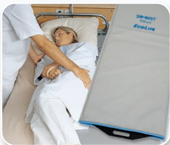
SAMARIT Rollbord ECOLite