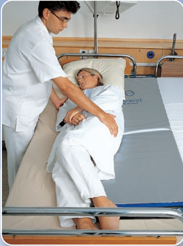
Den Patienten auf die Seite drehen, das Rollbord unter den Patienten schieben und den Patienten in die Ausgangslage zurückbringen.